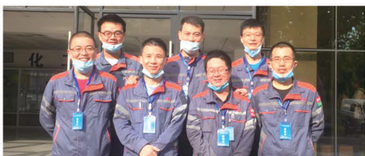
化工公司综合管理办公室

任重而道远,坚持高标准高质量,制定科学有效的防控机制,是神驰一直在做的。紧盯薄弱环节,查找隐患,一抓到底,逐步清零,压实责任制定整改方案,防范化解安全风险为企业的长效机制发展贡献自己的力量。