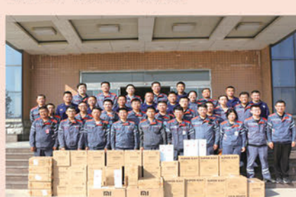
化工公司综合管理办公室

比赛圆满结束，名次和奖品已不再重要，晴朗的蓝天下同事们满脸的笑容，才是最幸福的事情，至此化工公司全员运动会向这个特殊的节日献礼！