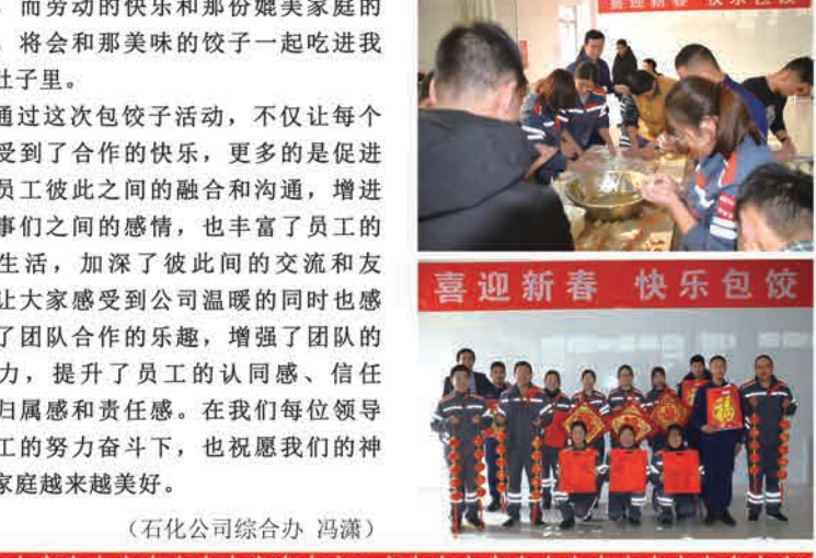
喜迎新春 快乐包饺子

新春吃个安全饺，幸福日子常环绕。除夕晚上，化工公司总经理将精心准备的“爱心水饺”，亲自送到恪守在岗位的神驰人，并为他们送上新春祝福。小小的饺子为坚守在工作岗位上的职工带去了亲情，带去了温暖，也带去了家一般的团聚和问候。