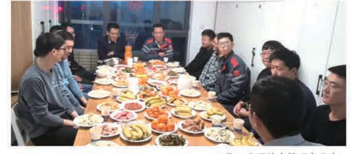
(化工公司综合管理办公室)

春联蕴含着公司美好的祝福和心愿，使节日的来临充满了浓浓的年味，今天能拿到大红春联，来年工作和生活一定能够红红火火。