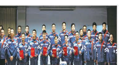
(化工公司安全文化分会)

为进一步加强学习型组织建设，提升内训师技能水平，加大内训课程开发力度，发现和建设一支“业务精、能力强、素质好”的内部师资队伍，助力化工公司整体培训教育体系的建立健全。旨在通过比赛的形式，激活公司内部训师的教和学热情，促进内训师的快速产生和学习成长。